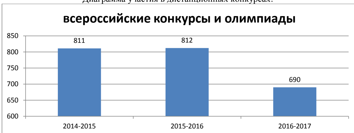
Диаграмма участия в дистанционных конкурсах:

Обучающиеся гимназии являются победителями и призерами городского этапа Всероссийской предметной олимпиады. В данном учебном году наблюдается повышение результативности участия: 2015год –6 победителей и призеров, 2016-12 победителей и призеров :